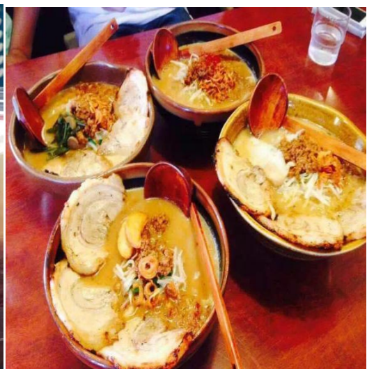
(上图为鲸鱼肉和福冈拉面)