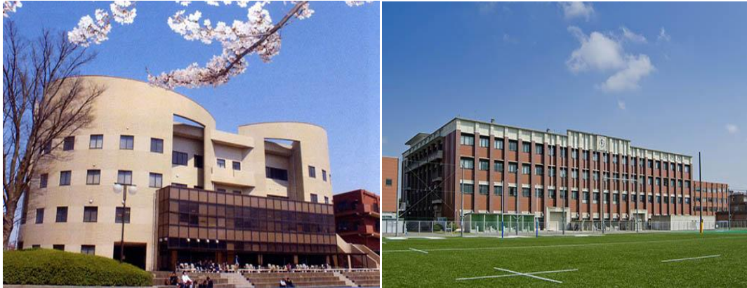
(上图为教学楼、操场)