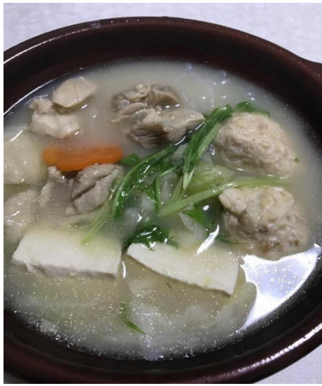
(上图为大肠锅和关东煮)