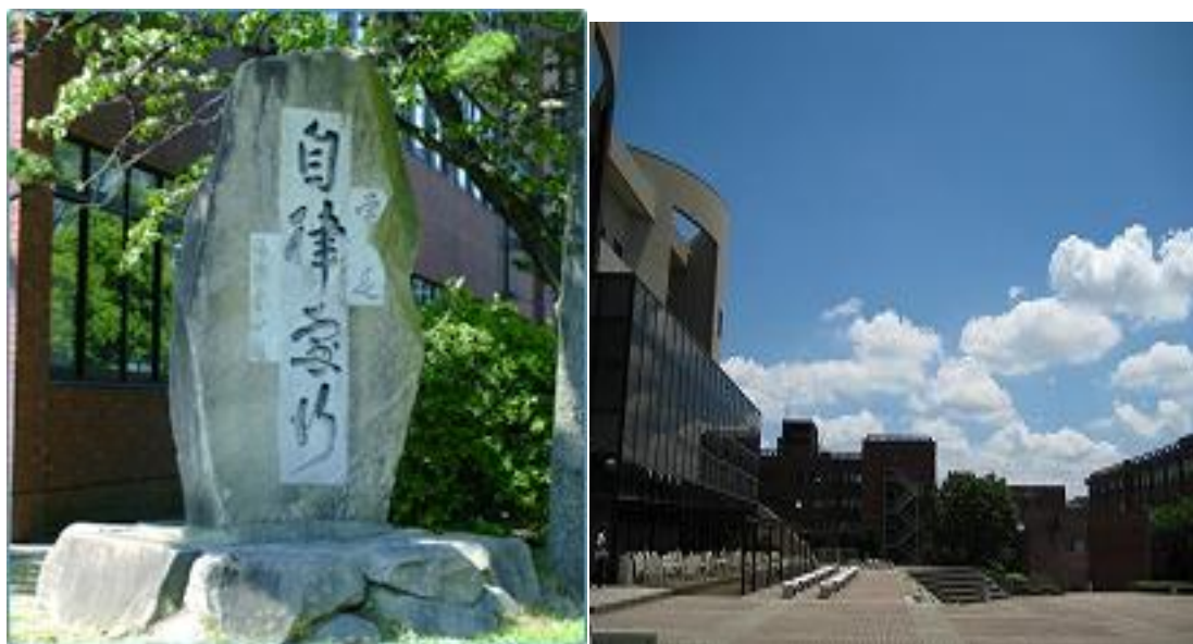
（上图为学校的校碑、校园环境）