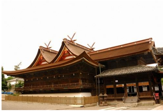
吉備津神社（きびつじんじゃ）