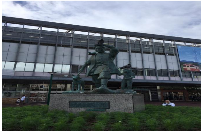
桃太郎雕像（冈山市是桃太郎的故乡）

纵贯市内南北的旭川沿岸是主要的名胜风景区。这里有面积达 13 万 m 2 的日本三大名园之一——冈山后乐园，在它的附近还有冈山县立博物馆，河对岸有冈山城，冈山县立美术馆，冈山市立东方美术馆等。