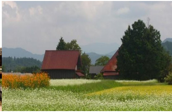
蒜山高原（ひるぜんこうげん）